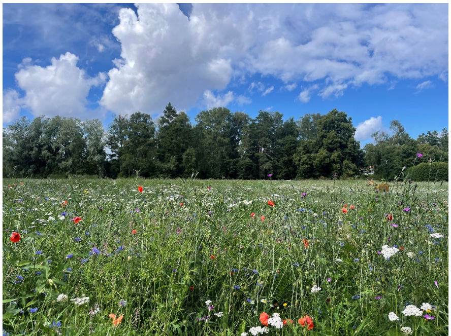
Olympiaplans äng i blom; Vallmo, Rölrika, Klint, Klätt och flera andra arter, sommaren 2025.

Delar av Olympiaplans södra del iordningsställdes till ängsyta under våren 2025. Detta mot bakgrund av uppdrag i kommunfullmäktiges budget och i nämndens verksamhetsplan för 2025 att ytor med högvuxet gräs och äng ska öka i staden. Detta ligger även i linje med stadens handlingsplan för biologisk mångfald. Anläggandet finansierades genom särskilda medel för biologisk mångfald som nämnden ansökte om i samband med verksamhetsplanen. Redan första året var blomningen riklig med många olika arter av ängsflora.