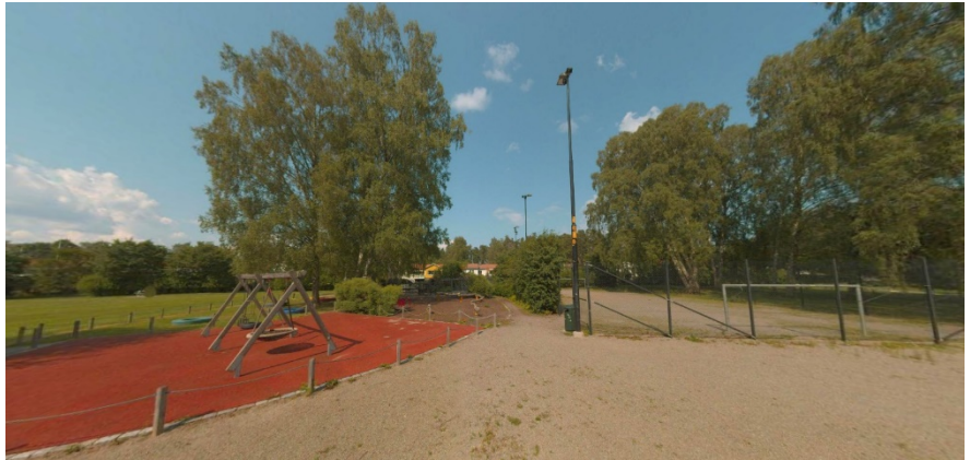
Delar av lekplatsen och bollplanen på norra Olympiaplan.

Delar av Olympiaplans södra del iordningsställdes till ängsyta under våren 2025. Detta mot bakgrund av uppdrag i kommunfullmäktiges budget och i nämndens verksamhetsplan för 2025 att ytor med högvuxet gräs och äng ska öka i staden. Detta ligger även i linje med stadens handlingsplan för biologisk mångfald. Anläggandet finansierades genom särskilda medel för biologisk mångfald som nämnden ansökte om i samband med verksamhetsplanen. Redan första året var blomningen riklig med många olika arter av ängsflora.